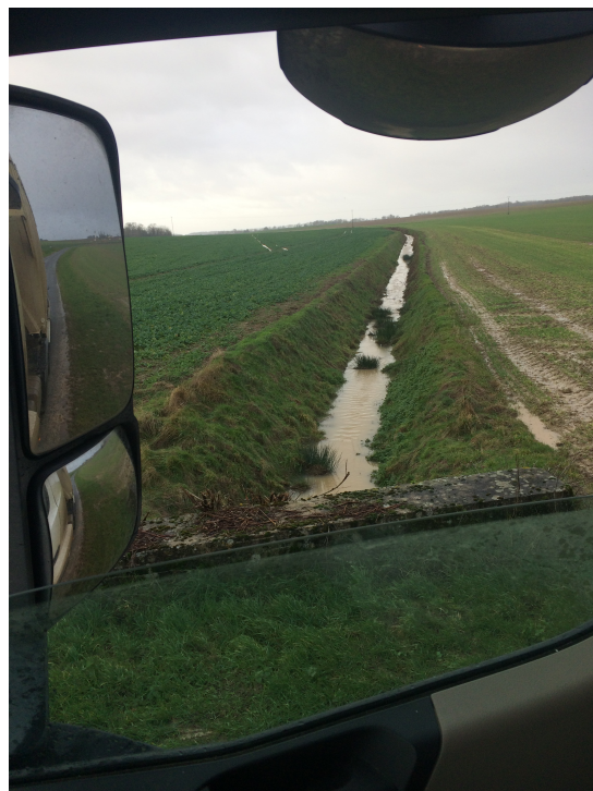
Image 3 Ru du Louva